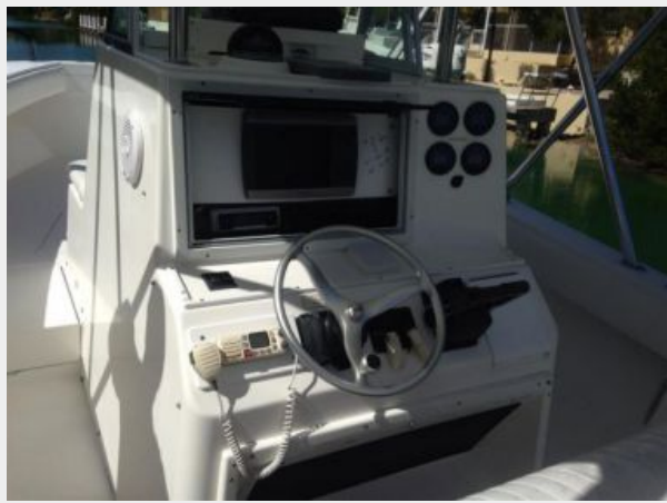
Center console with operator controls