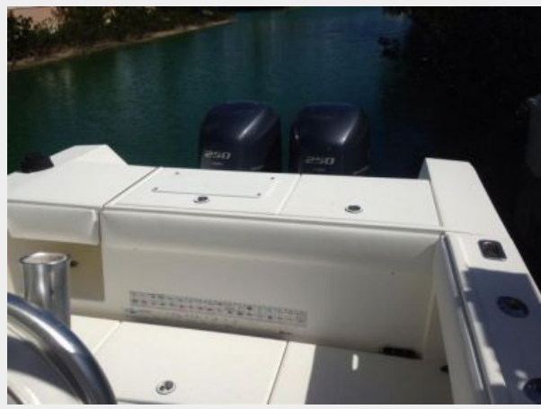
Port aft deck and transom live well, ice box