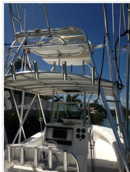
Half tower and Marlin station