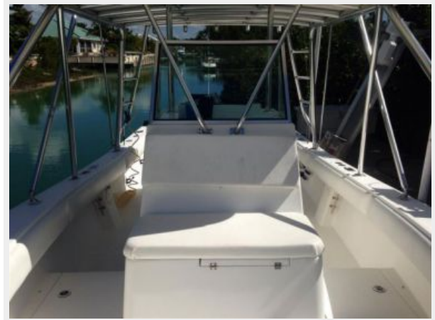
Forward seating on center console