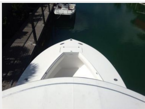
Bow from upper control station