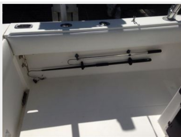
Port aft deck and gunwale