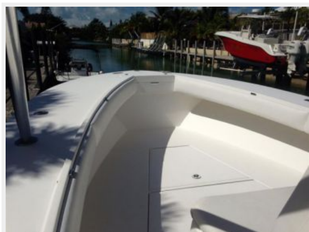
Port forward bow deck