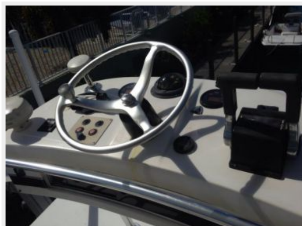
Upper control station