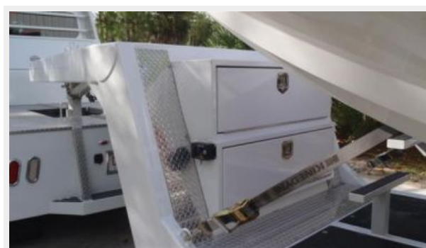
Built-in Tool Boxes on Trailer