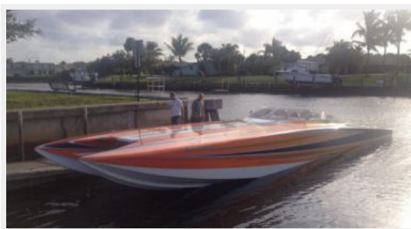
Profile at Dock