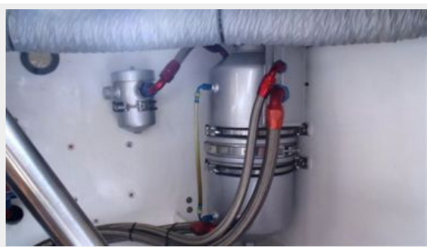
Engine Oil Reservoir