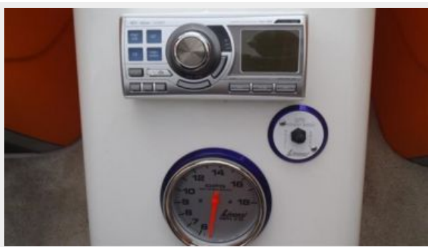
Rear Seat Console