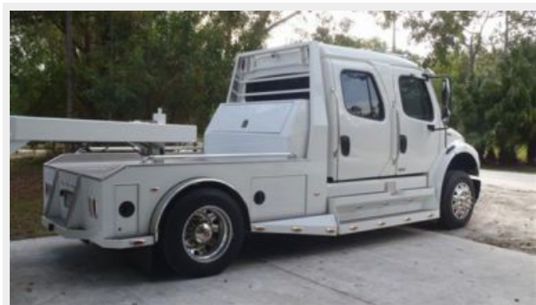
2009 Freightliner Sport Chasis