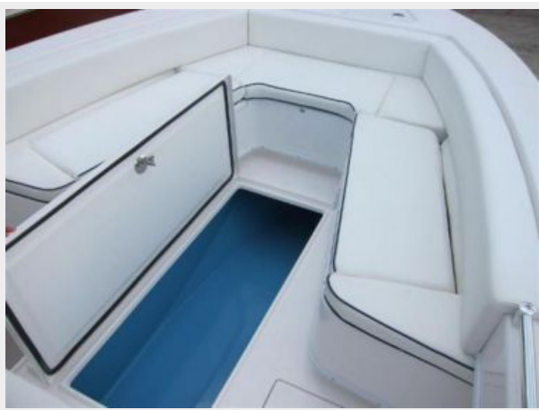
Insulated Fish Box