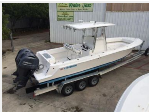
Contender 28 Sport