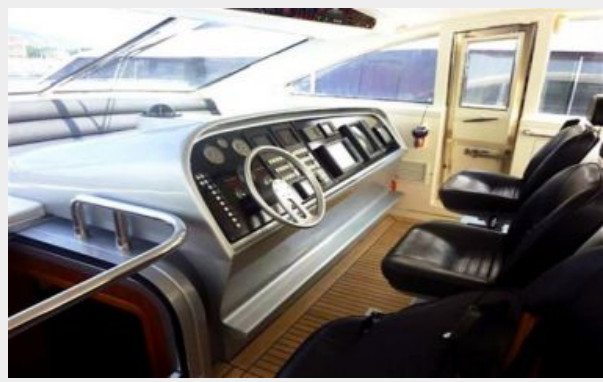
Helm / bridge