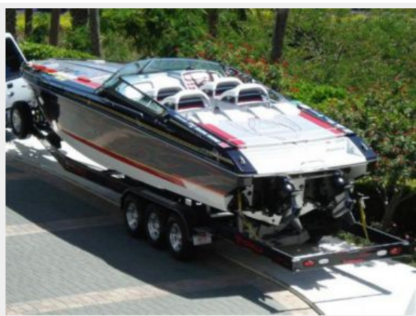
On her trailer