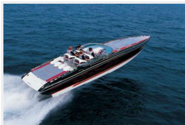
Actual Formula being advertised