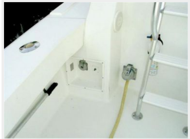
Freezer, Bait Center, Engine Controls and Tackle Drawers Below