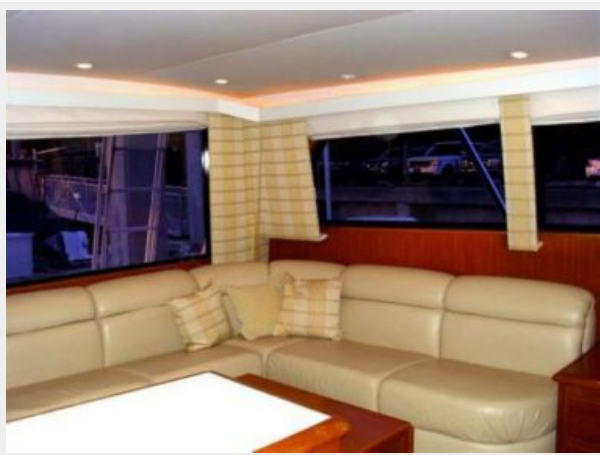
Flybridge Forward Seating and Under Bow Storage