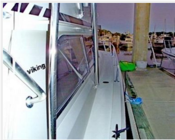
Glenn Denning Cable Recoiler