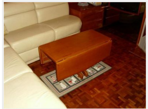
Salon L Shaped Sofa W/Storage