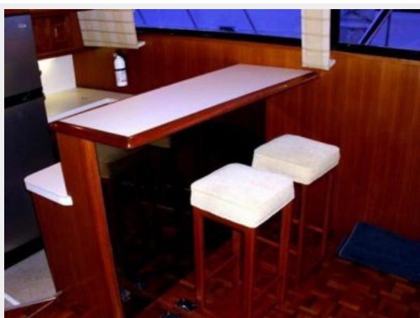
Breakfast Bar W/Two Stools