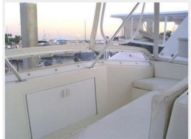
Flybridge Portside Sun Lounge