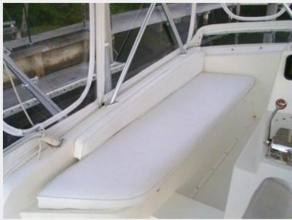
One of Two Overhead Instrument Pod