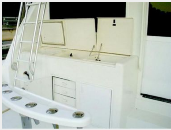
Cockpit Tackle Center Rocket Launcher