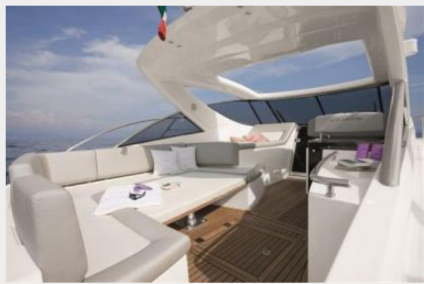
Flybridge- Facing forward