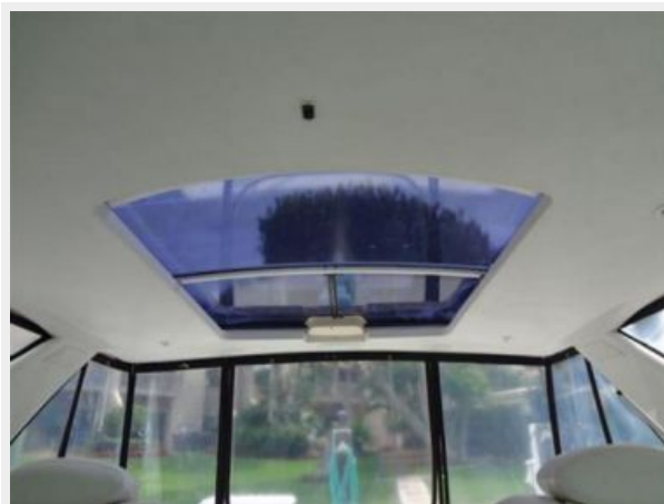
Power sliding sunroof