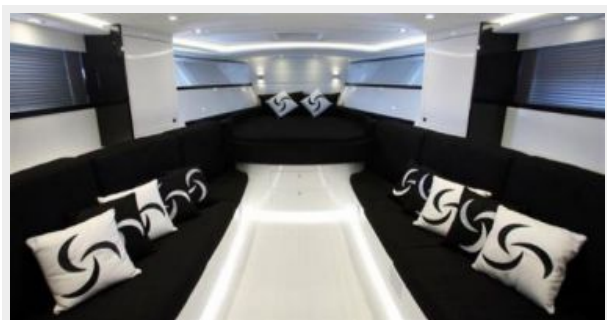
Otam 45 facing forward