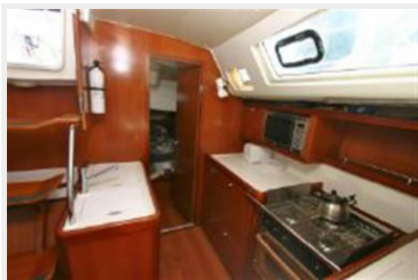
Door to port aft stateroom