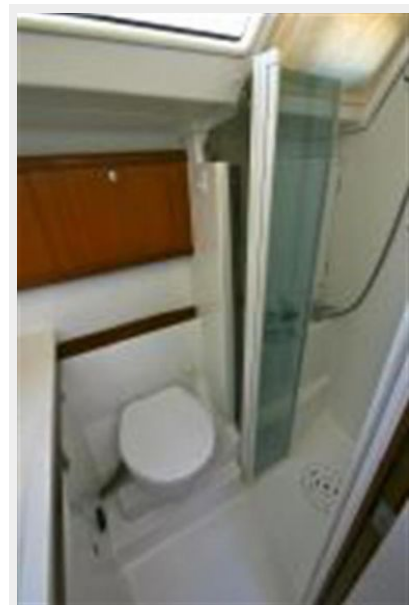
Aft head from salon