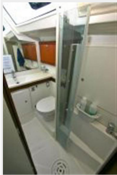
Aft head from stbd. aft stateroom