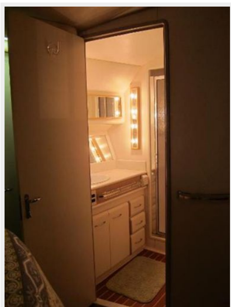
Master Stateroom Head