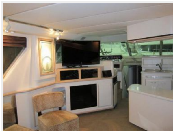
Entertainment Center Port side