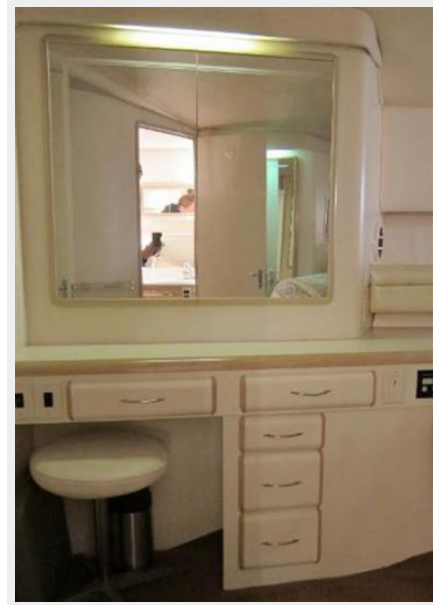
Master Stateroom Vanity with concealed hanging locker