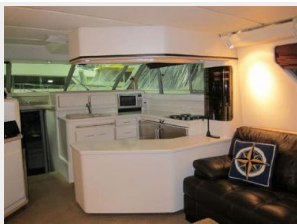
Galley/Salon Looking Forward