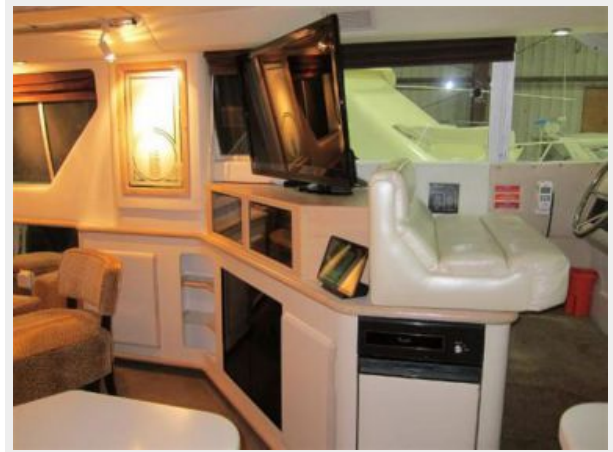
Lower Helm/Entertainment Center