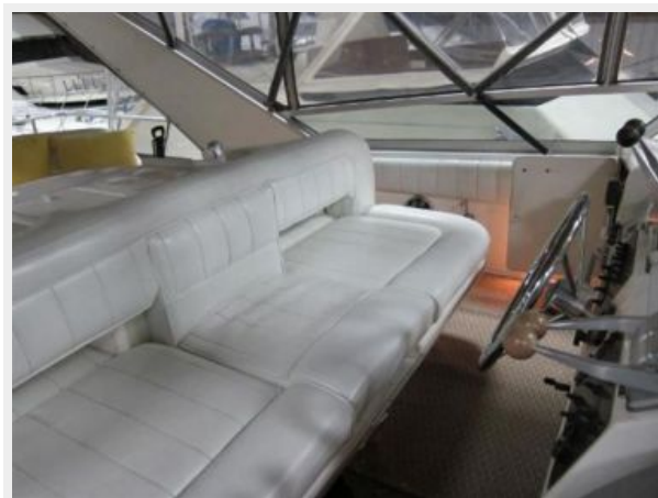
Flybridge Helm Seating