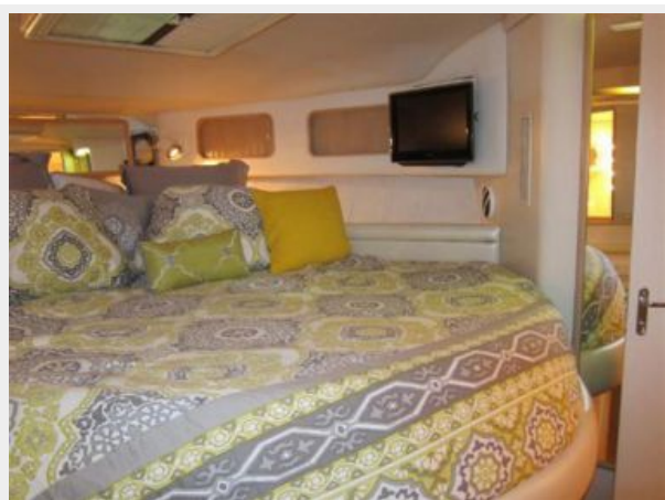
Master Stateroom King size bed