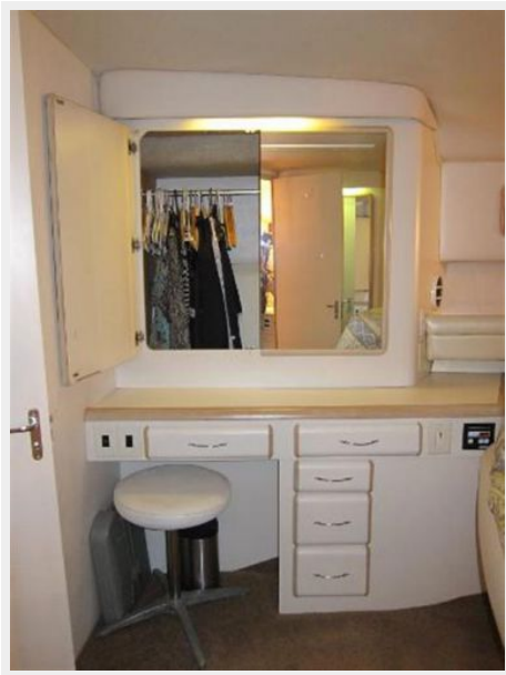
Master Stateroom Vanity to Port