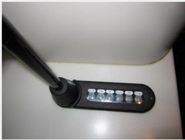
SideBar Fluid Dispenser