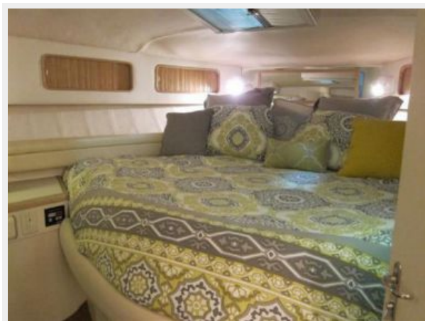
Master Stateroom 2