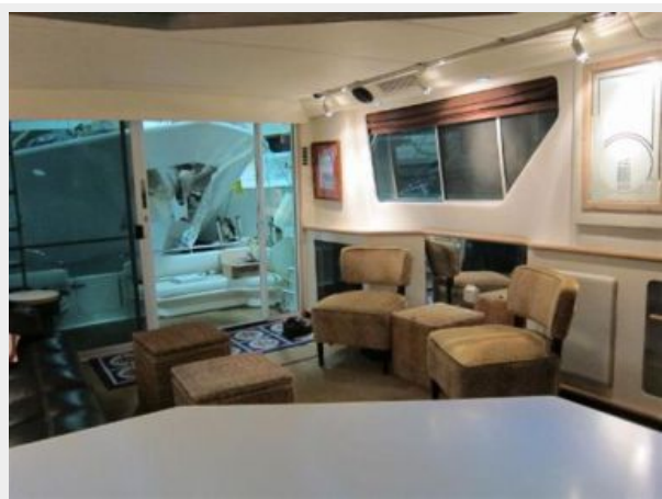
Salon looking aft