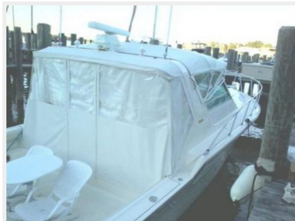
Custom Drop Curtain