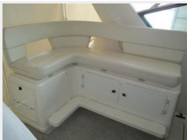
L Bench seat