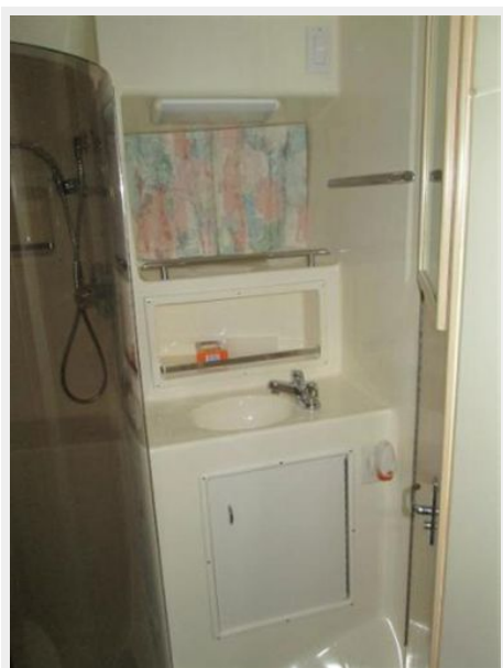
Head with Seperate Shower