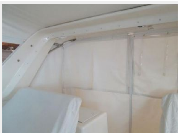
Inside View Custom Drop Curtain