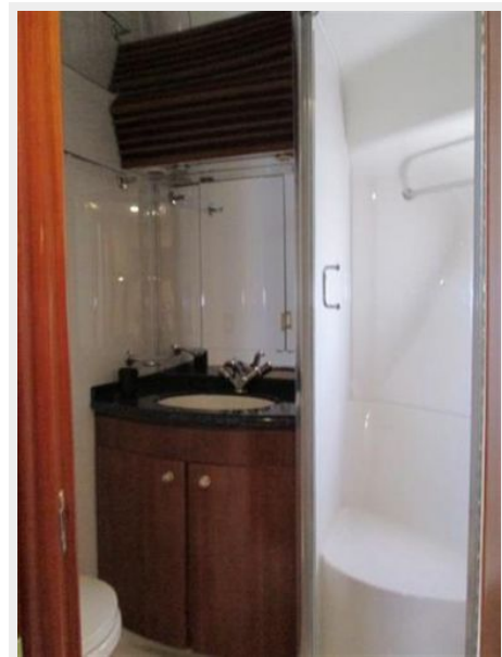
Master Head with Shower and Vanity