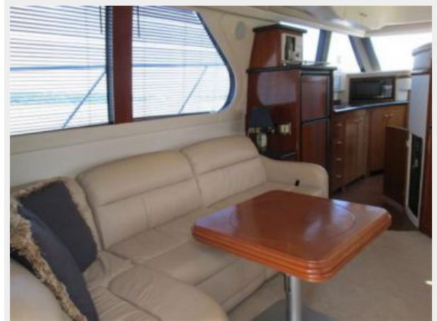
Salon Port from Aft Facing Forward