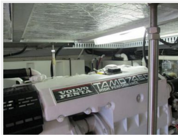
Port Volvo T-74P Engine