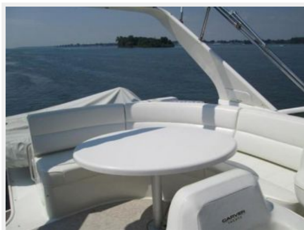
Flybridge Bench Seating and Table