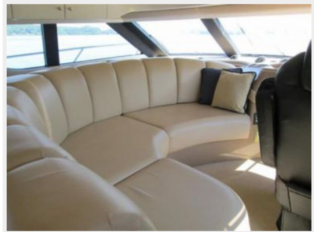
Lower Helm Seating