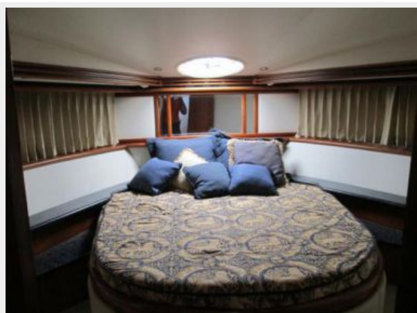
Forward Queen Berth