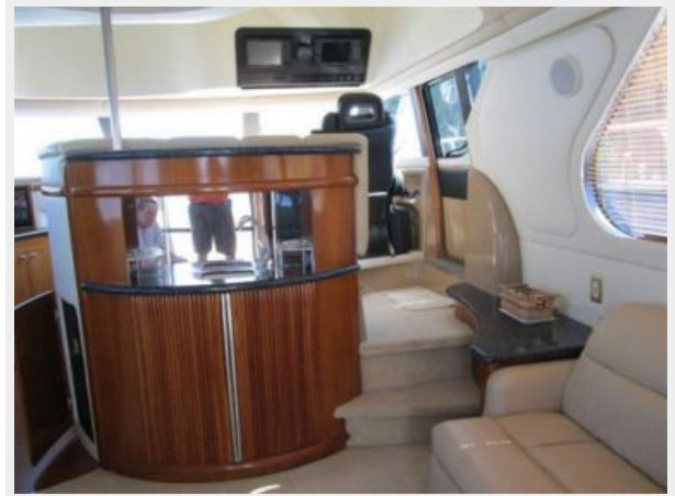
Wet Bar Mid-ship aft to the Lower Helm