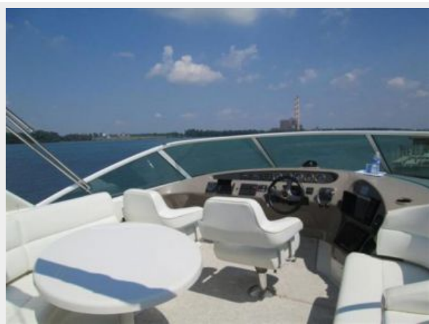
Flybridge Seating and Helm