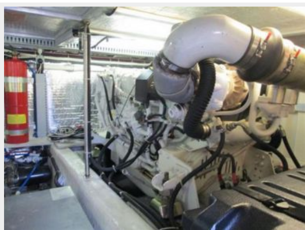
Starboard Volvo T-74P Engine