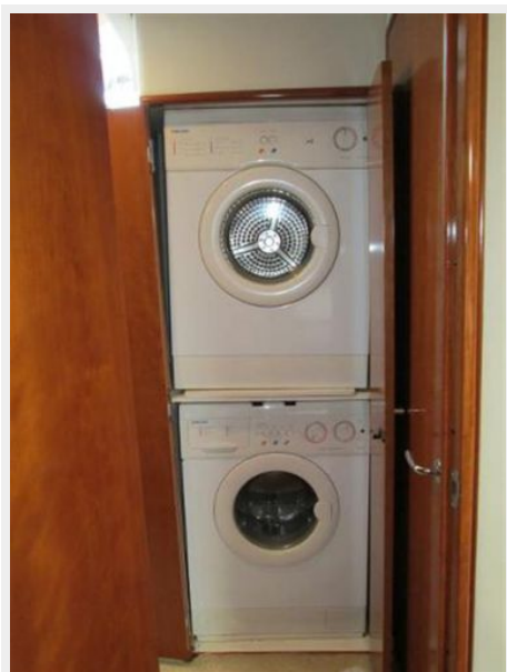
Washer and Dryer