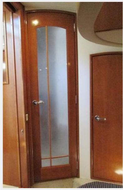
Master suite Door to head