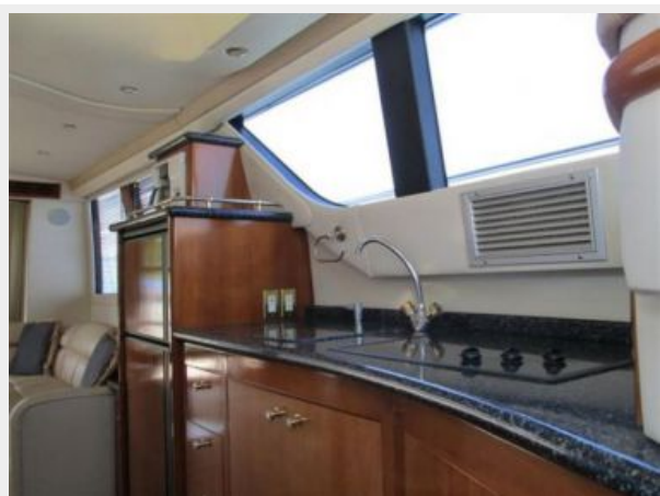
Galley from Forward Facing Aft