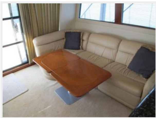
Salon Port Seating with extended Table Facing Aft