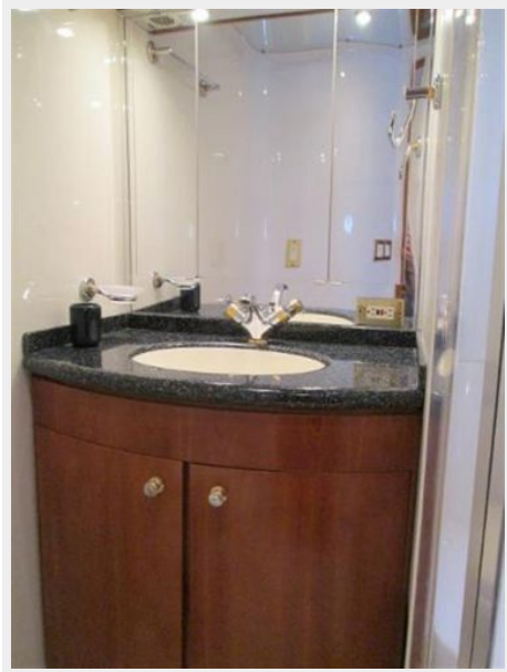
Master Vanity W/ sink and Mirror