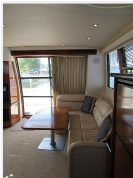
Port Salon Seating with Table Facing aft