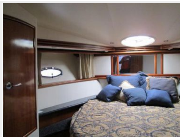
Forward Berth with Opening Port