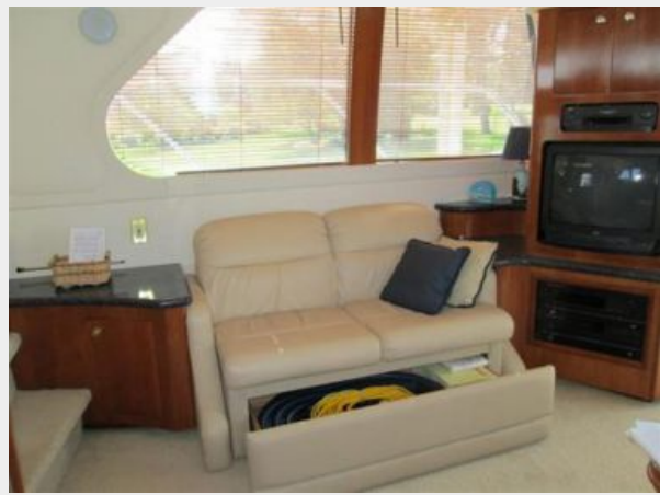
Salon Seating with Storage Stb. side