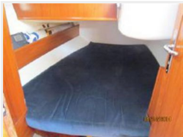
Starboard Aft Cabin