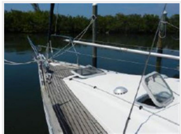
Teak Decks in Good Condition