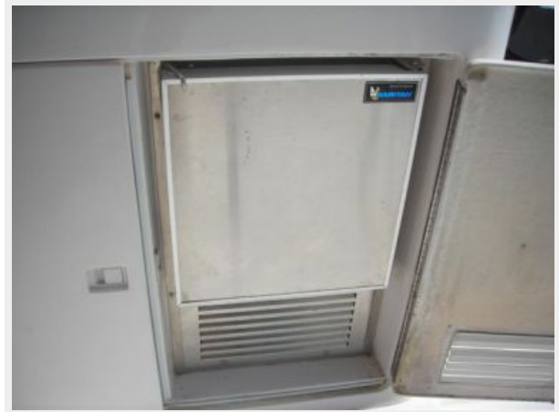
Cockpit ice maker