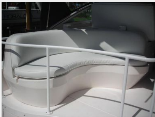
Aft cockpit seating