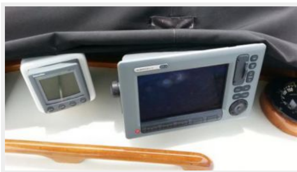
Bridge Helm Electronics