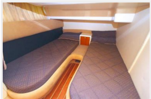
guest state room