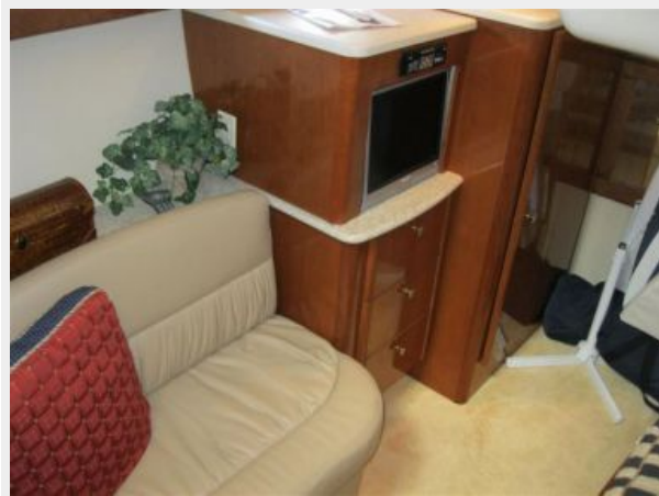
Mid Ship Stateroom