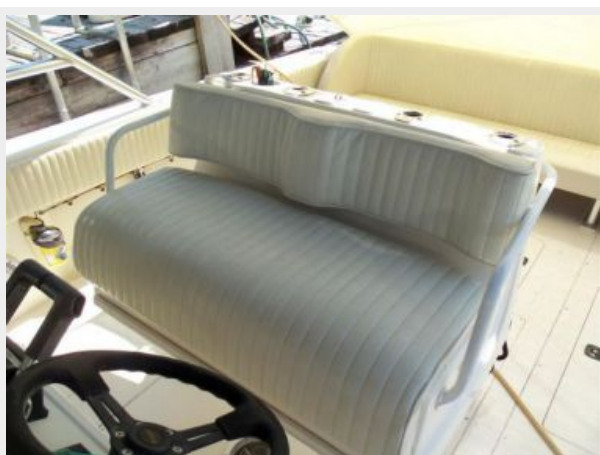
Electric Helm Seat