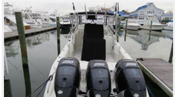
Triton 351 Express Helm Seat Cover