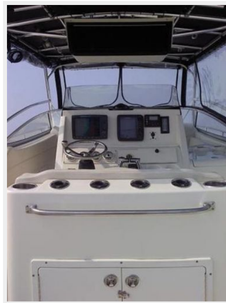
Triton 351 Express Helm