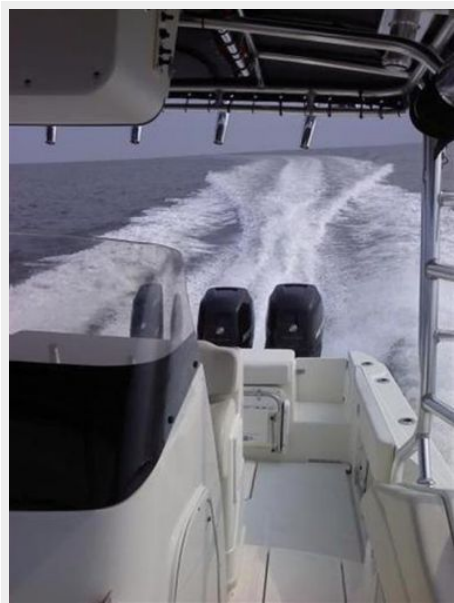
Triton 351 Running