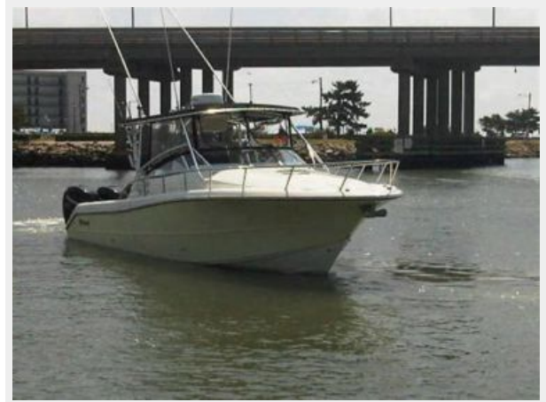
Triton 351 Express Front Profile