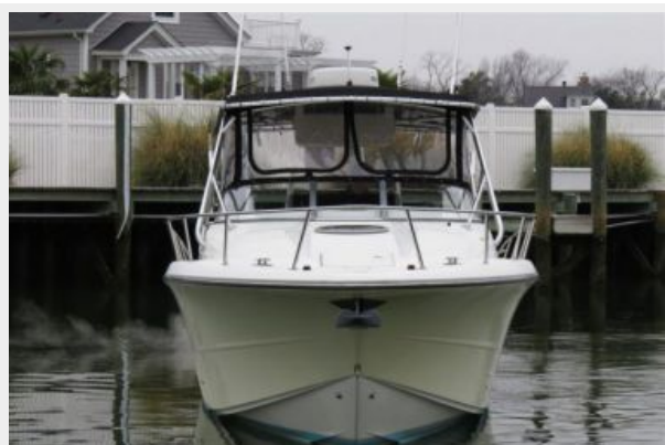
Triton 351 Express Bow