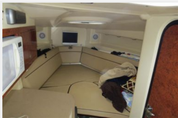
Triton 351 Express Cabin Forward