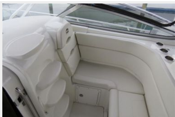
Triton 351 Express Forward Helm Seating