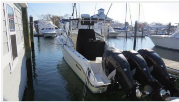
Triton 351 Express Helm Covers & Full Canvas