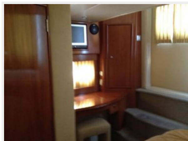
Aft Stateroom desk