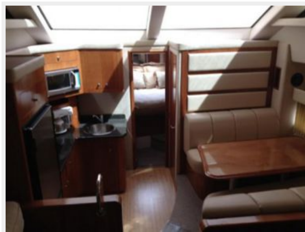
Large Galley and Settee