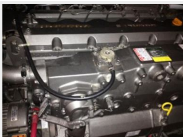
Spotless Engine compartment