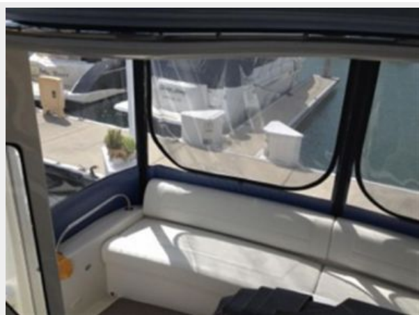
Aft Deck Starboard Seating