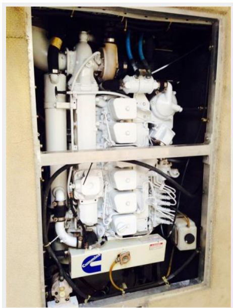
Engine Room 2