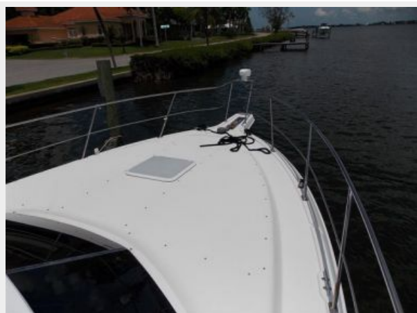
Forward Deck from Starboard Side