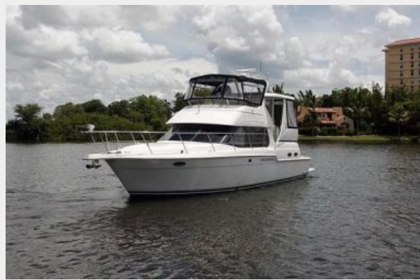
Port Forward Quarter