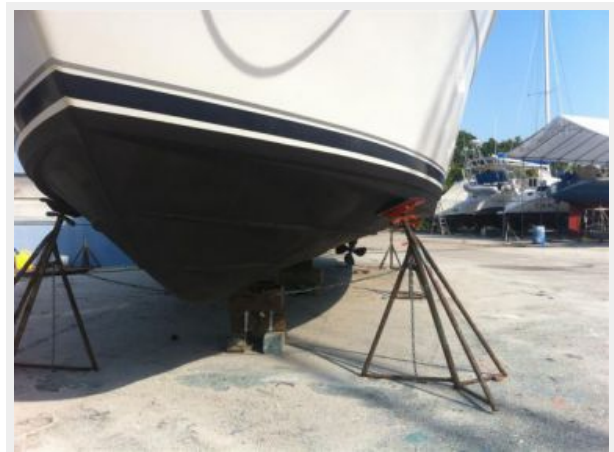
New Bottom Job 2