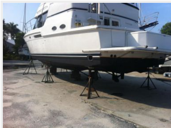
New Bottom Job 1