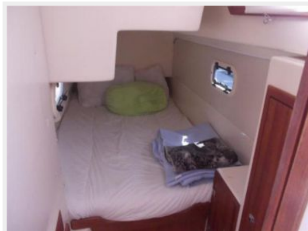
Starboard Aft Cabin