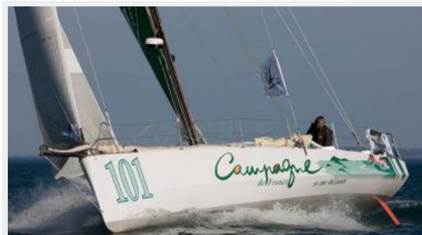
Pogo 40 S2 S/Y CAMPAGNE DE FRANCE - Structures / Mora / Finot Conq Pogo 40 S2 S/Y CAMPAGNE DE FRANCE - Structures / Mora / Finot Conq