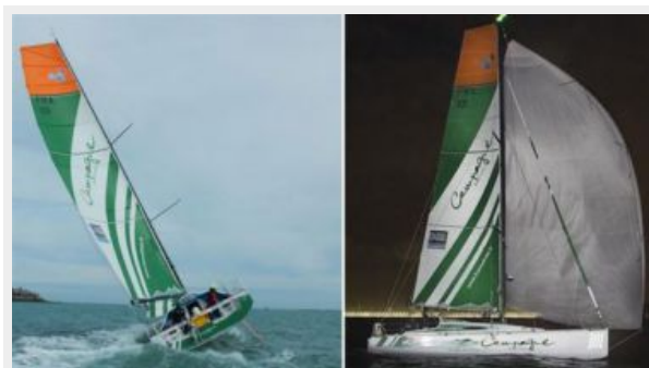
Pogo 40 S2 S/Y CAMPAGNE DE FRANCE - Structures / Mora / Finot Conq Pogo 40 S2 S/Y CAMPAGNE DE FRANCE - Structures / Mora / Finot Conq