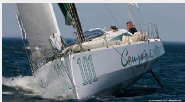
Pogo 40 S2 S/Y CAMPAGNE DE FRANCE - Structures / Mora / Finot Conq Pogo 40 S2 S/Y CAMPAGNE DE FRANCE - Structures / Mora / Finot Conq