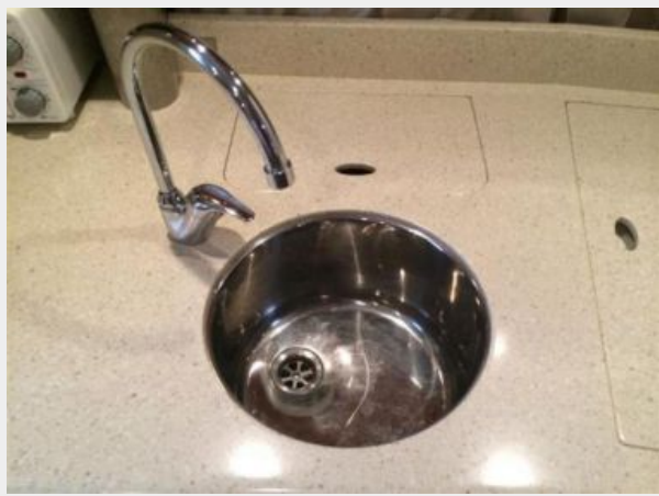
Stainless Steel Sink