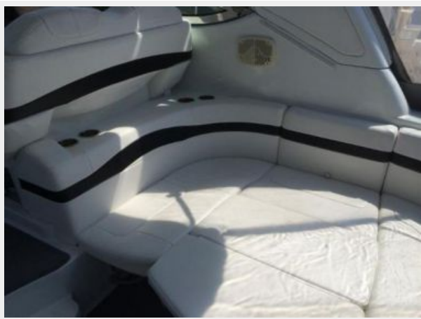
Aft Seating / Sun Pad