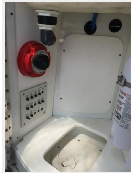
Under Port Wet Bar / Custom Trash Can Holder