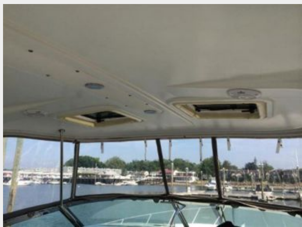
Sun roof / vents