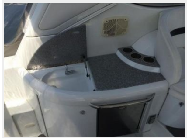
Port Wet Bar / Sink