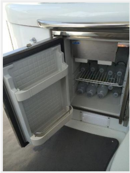
Port Wet Bar / Refrigerator