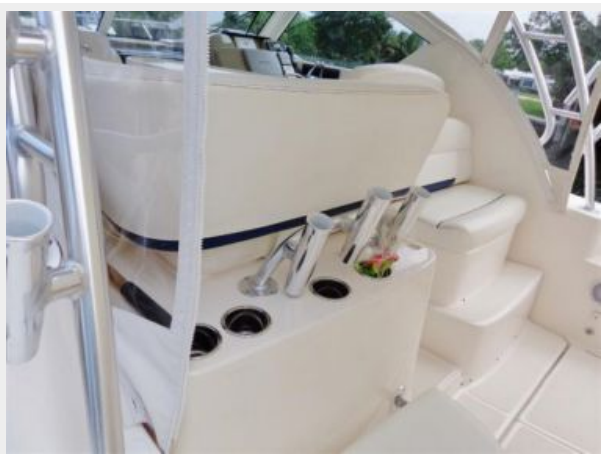
Cup & Rod Holders