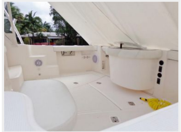
Cockpit and Live Well