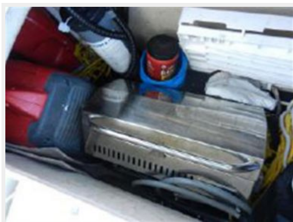
Honda generator and BBQ grill