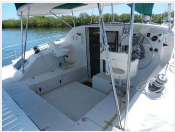
Generous cockpit seating