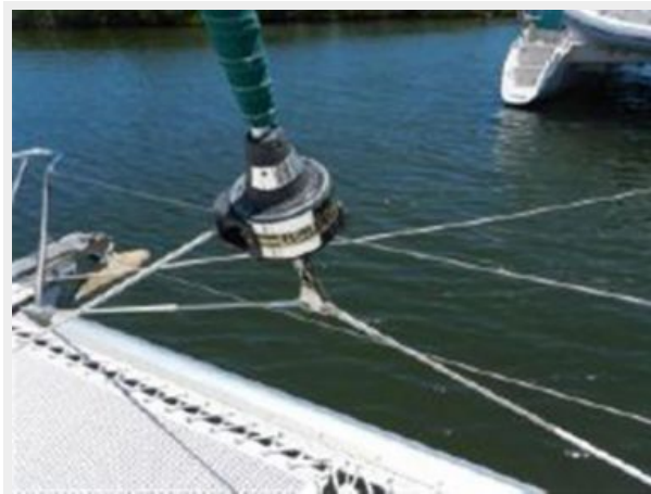
Roller furling genoa