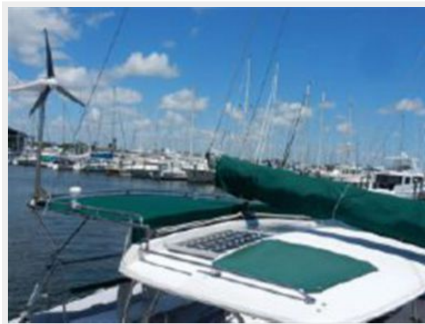
Custom shade extension beyond hardtop