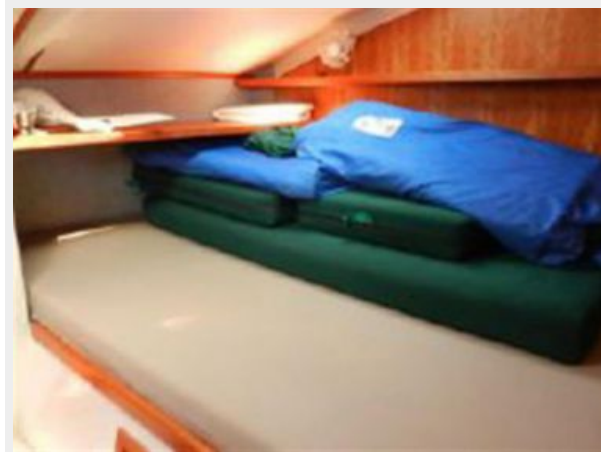
Cockpit cushions and sails