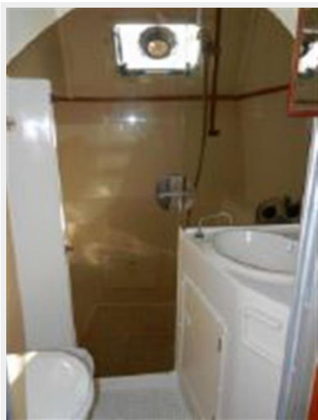
Large head and shower stall