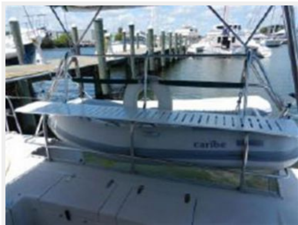
Custom stern bench seating w/ cushions