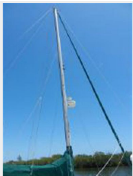
Mast and rigging, radar