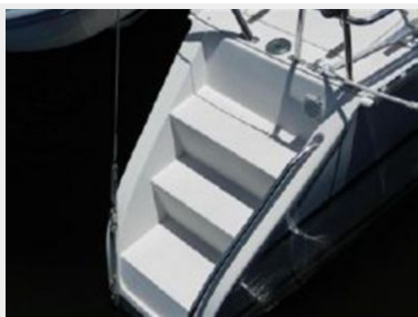
Great handholds on stern steps!