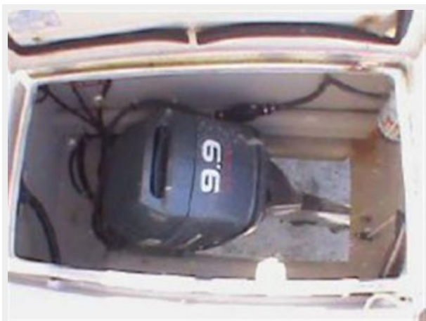
2005 Outboards, 1930 hrs