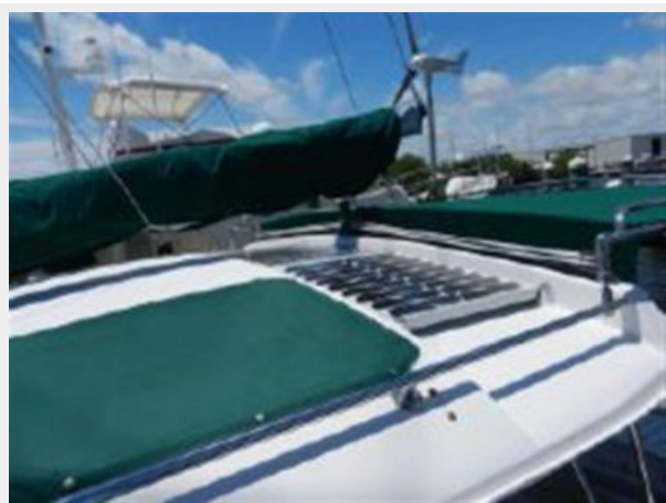
Solar and wind gen