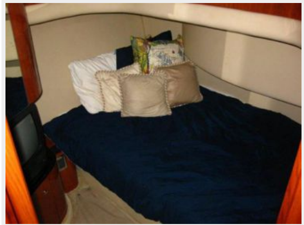
Guest Stateroom Storage