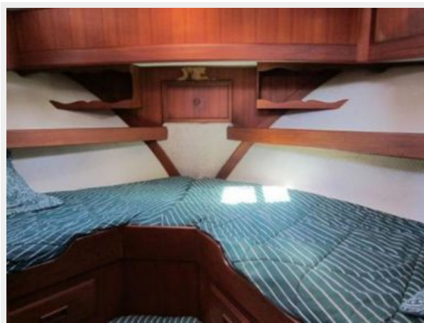
Forward Stateroom Vee berth