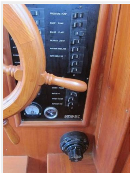
Lower Helm 3