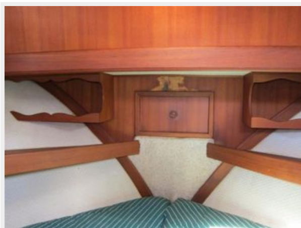
Forward Stateroom chain locker access