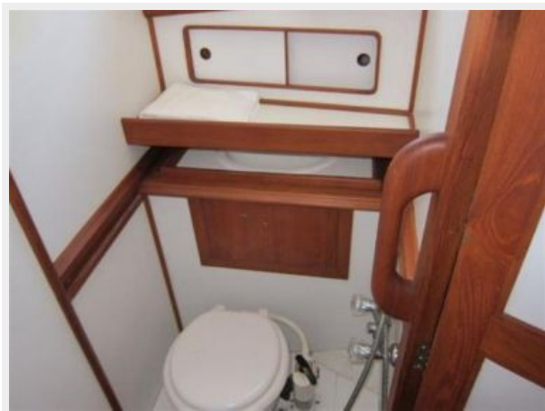
Forward Head 2