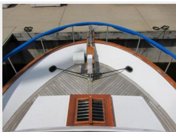
Bow from Flybridge