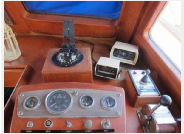
Lower Helm 2