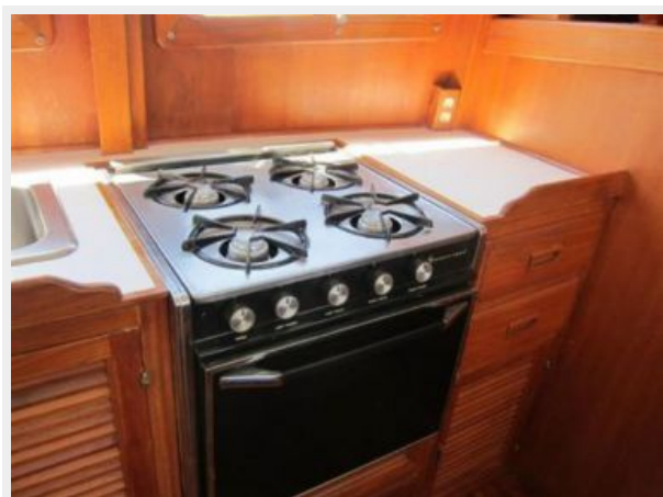
Galley stove -Propane