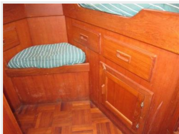
Forward Stateroom storage below berth