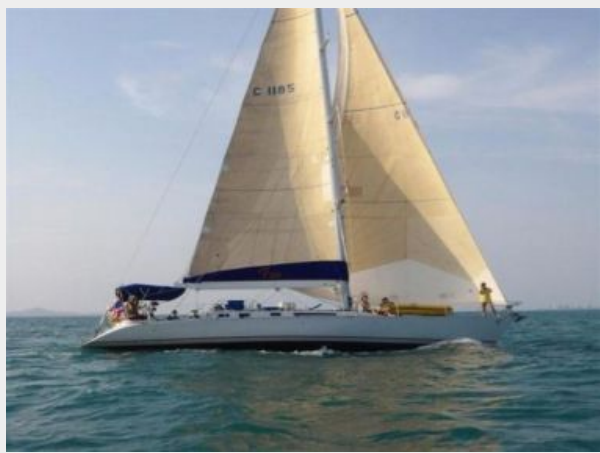
Beneteau First 51S - Profile