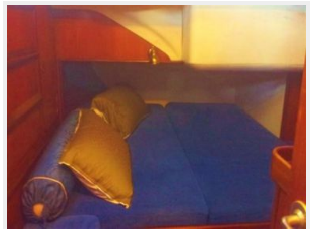
Beneteau First 51S - Cabin