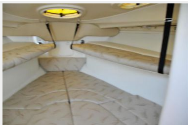
Starboard Side Bunk