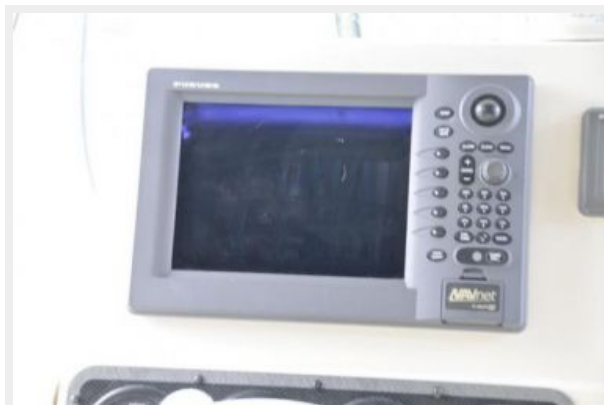
Electronics Detail 1