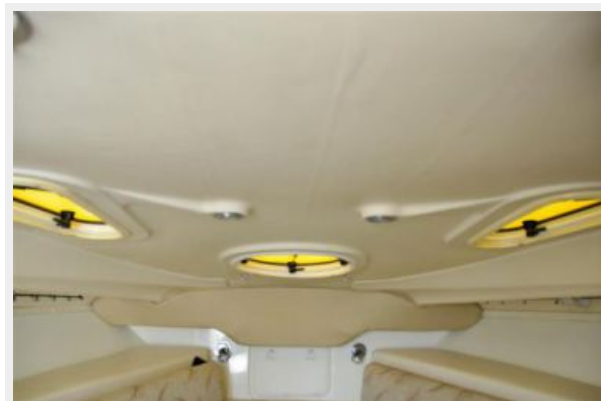
Ventilation and Egress