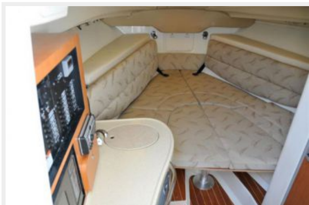
Walk Around Cuddy