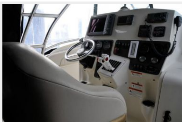
Angled Profile of Helm