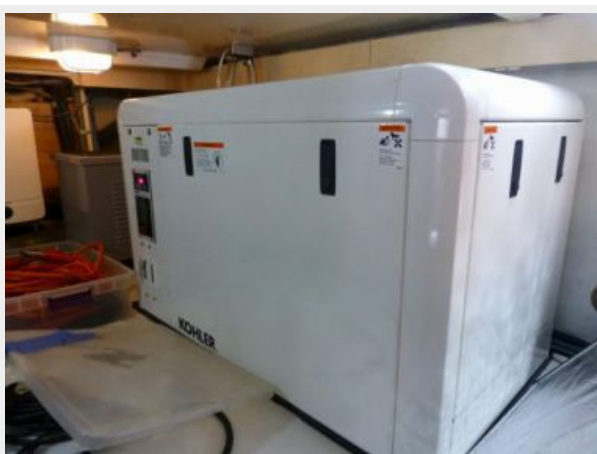
One of the two 2012 new Gensets (Both 120 hours)