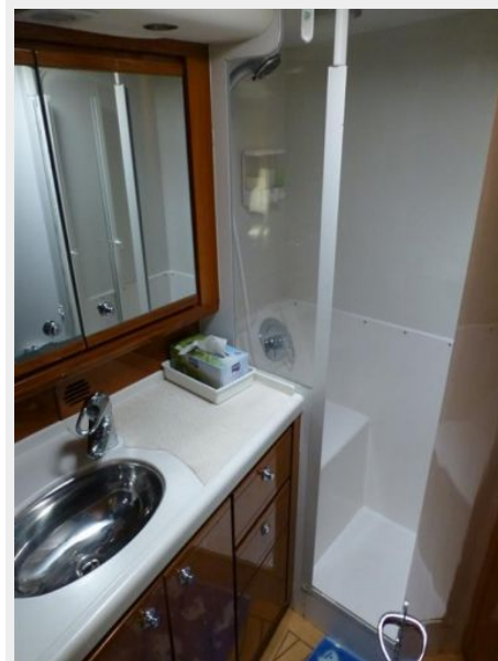
Forward Cabin Ensuite