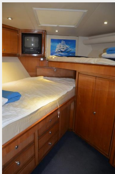
Forward Twin Cabin