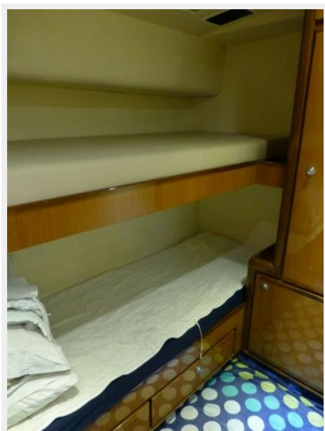
Starboard Twin Cabin