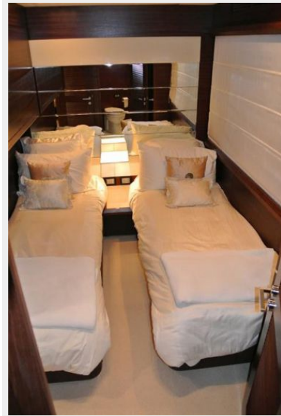
Guest Cabin 1