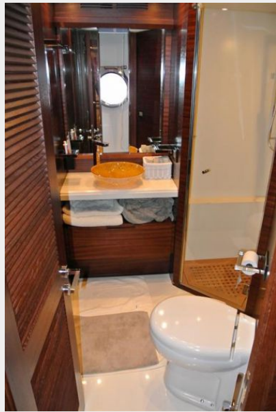
Shared Day Head