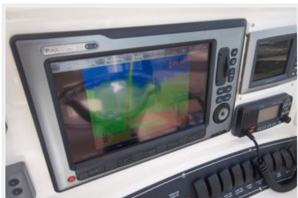
Electronics - FLIR