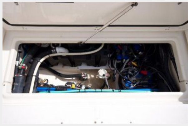
Bilge / Pumps / Batteries