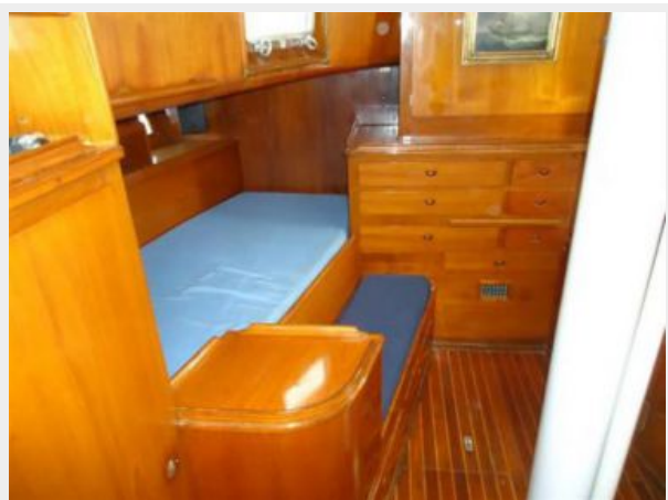
Starboard Berth Master Cabin