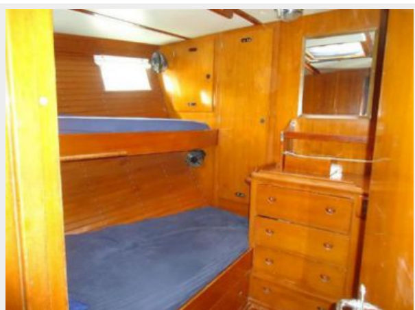
Port Guest Cabin