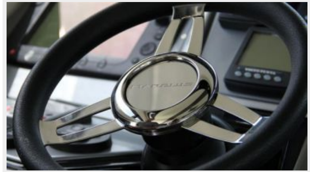
IPS Joystick Control