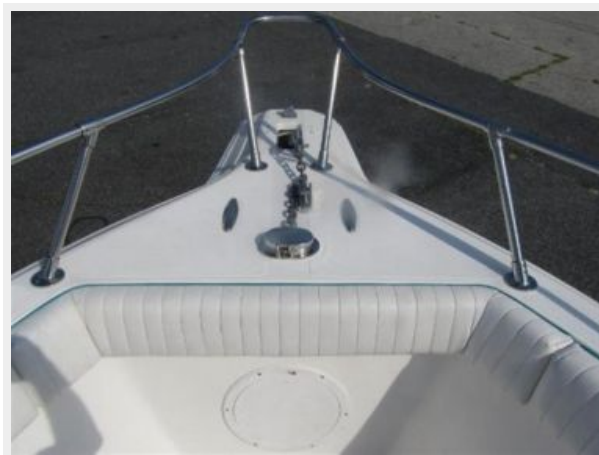
Bow Rail, Combing & Anchor