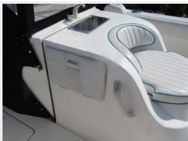
Aft Seat Tackle Center