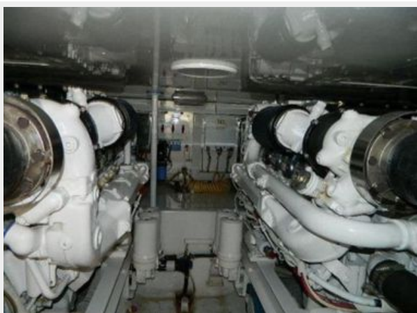
Engine & Mechanical Equipment 1 - Engine Room