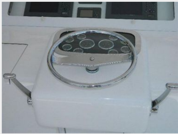
Helm / Electronics & Navigation 2