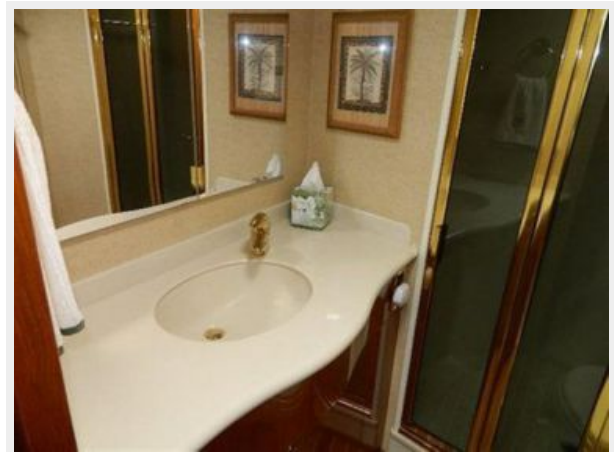
Master Head 1