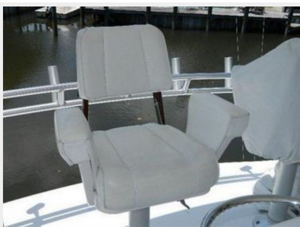
Deck 1 - Helm Seat