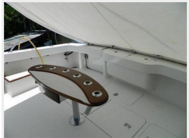
Cockpit / Fishing Equipment 3 - Rocket Launcher