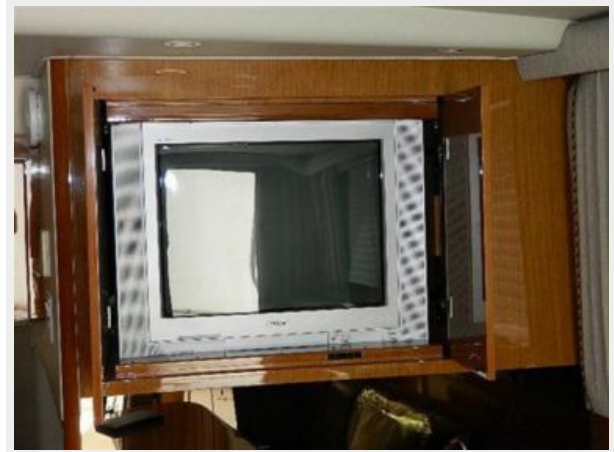
Salon 4 - TV