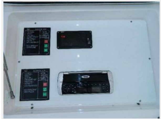
Helm / Electronics & Navigation 3