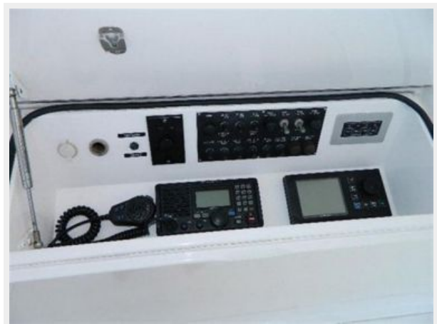
Helm / Electronics & Navigation 5