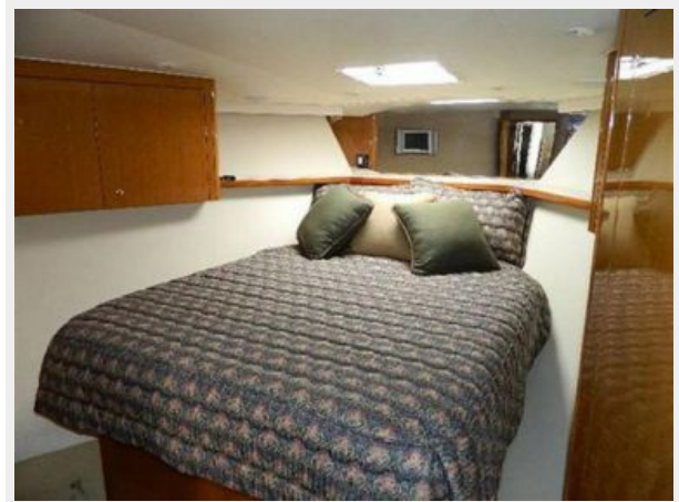
Master Stateroom 1