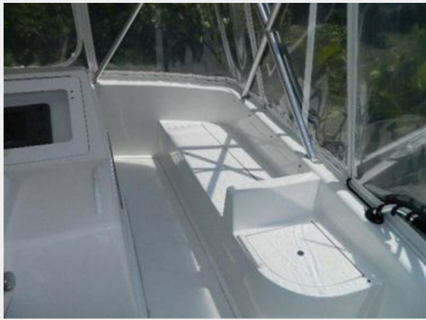
Deck 3 - Flybridge Seating