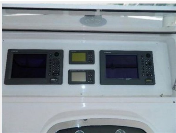
Helm / Electronics & Navigation 4