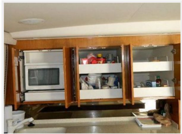
Galley 3 - Cabinets