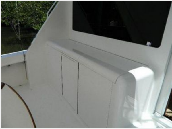
Cockpit / Fishing Equipment 2