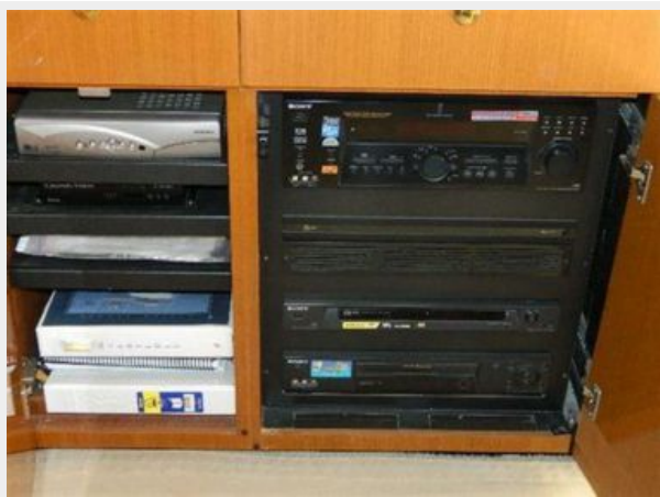
Salon 5 - Entertainment System