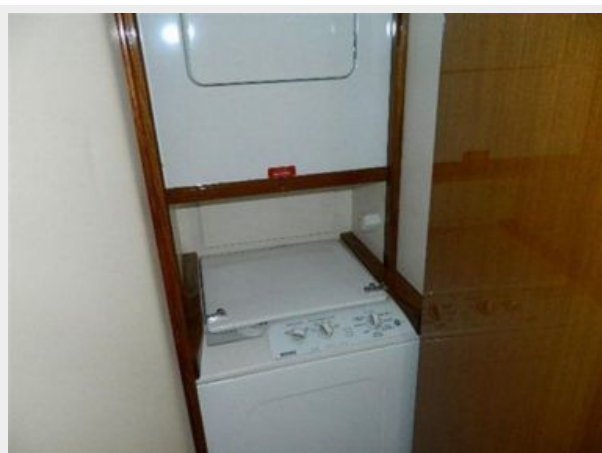
Laundry - Clothes Washer & Dryer