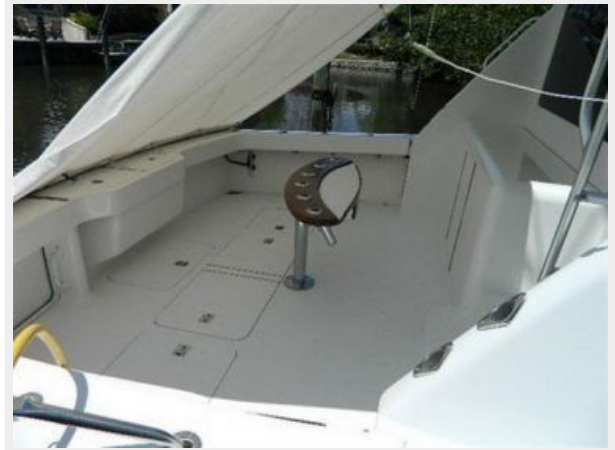
Cockpit / Fishing Equipment 1