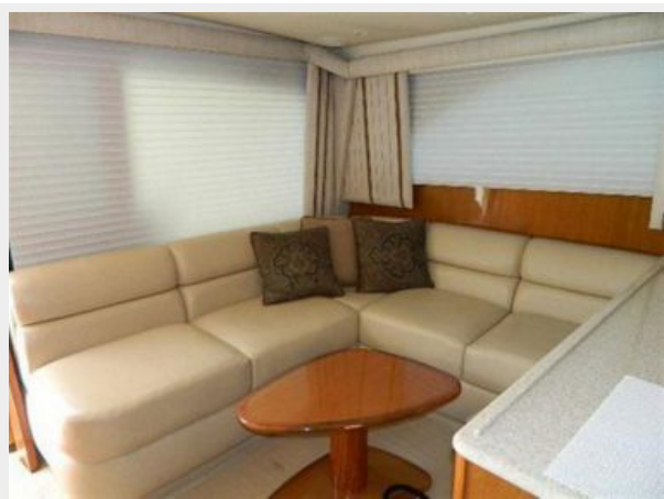
Salon 1 - Sofa