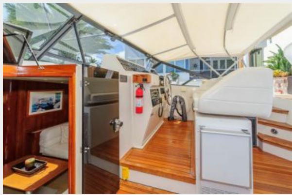
Cockpit Ice Maker