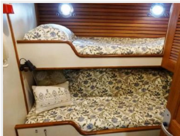
Port Guest Berths