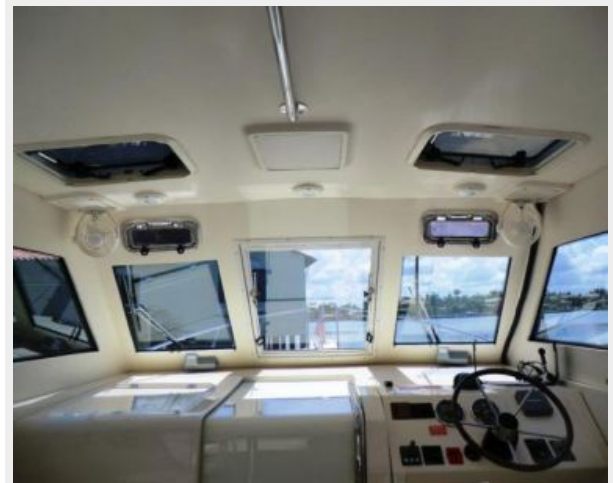
Upper Cockpit Ventilation