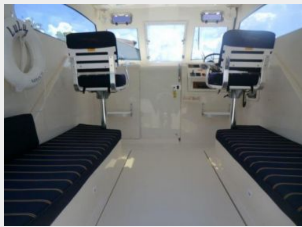
Upper Cockpit Looking Forward