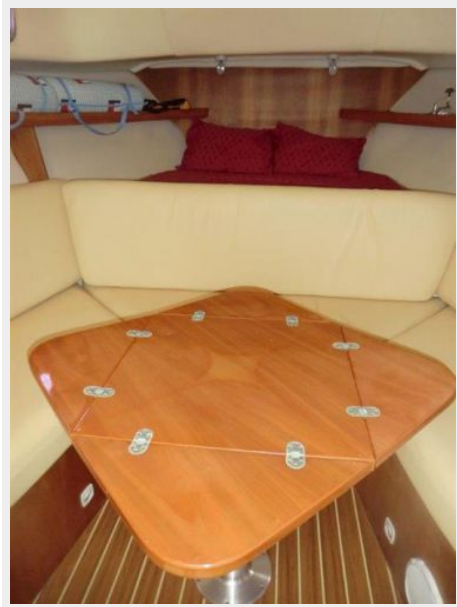
Dinette and Table