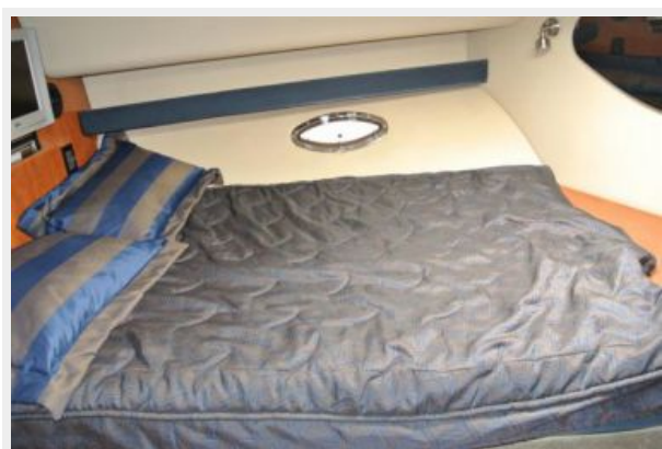
Guest Cabin Double Berth