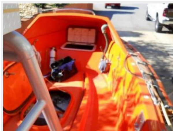
Access Hatch to the center console