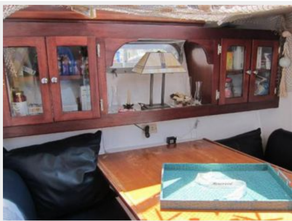
Custom Galley Cabinet