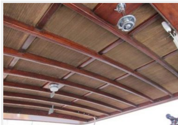
Hardtop at helm