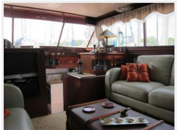
Salon Starboard looking forward