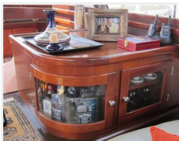
Custom Salon Cabinet Starboard