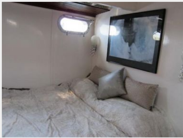
Queen Berth Aft Stateroom