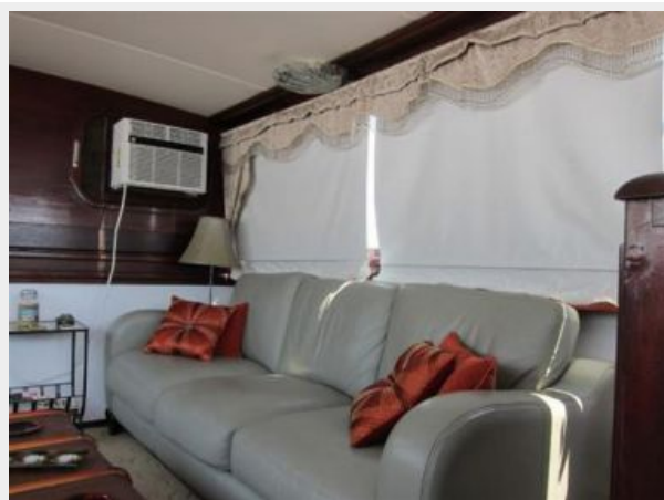
Salon Port looking aft