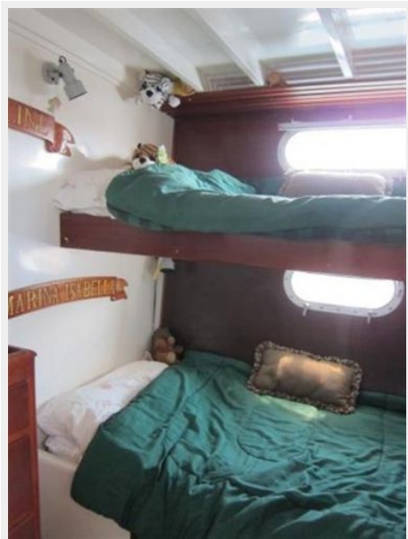
Aft Stateroom Vanity and storage