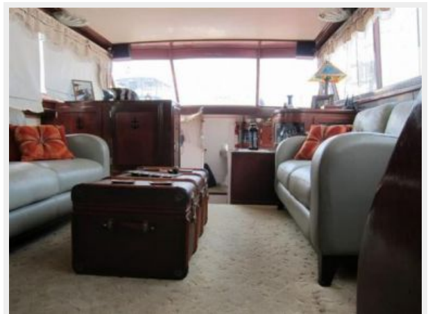
Salon looking forward