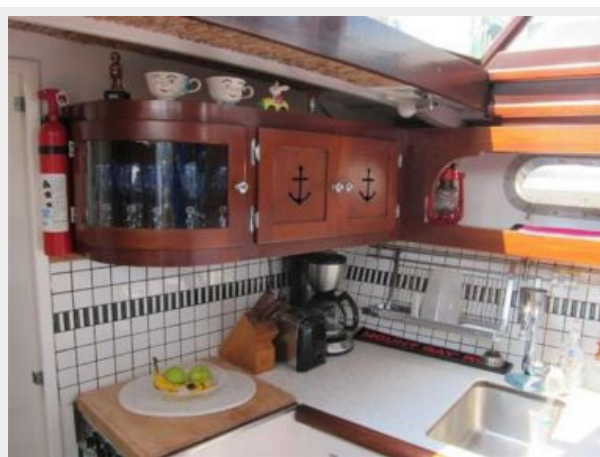
Galley down Starboard side