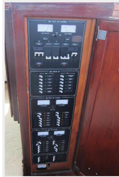
Upgraded electrical panel