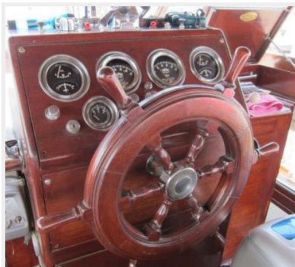
Helm - all gauges work