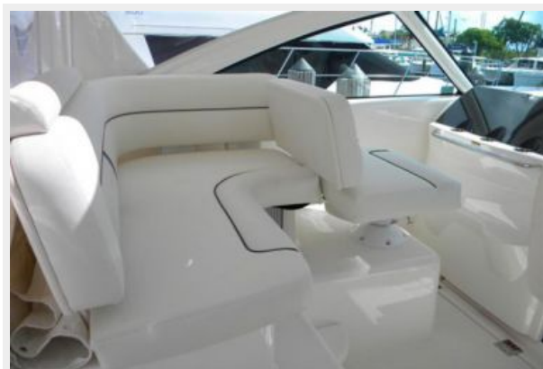
Port Helm Seating