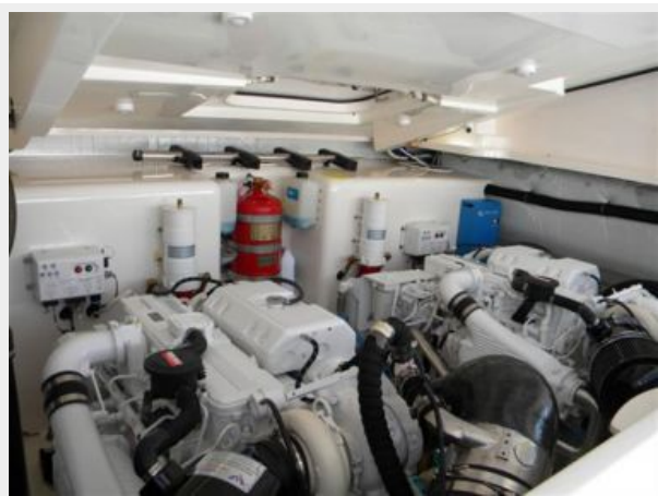
Engine Room Port