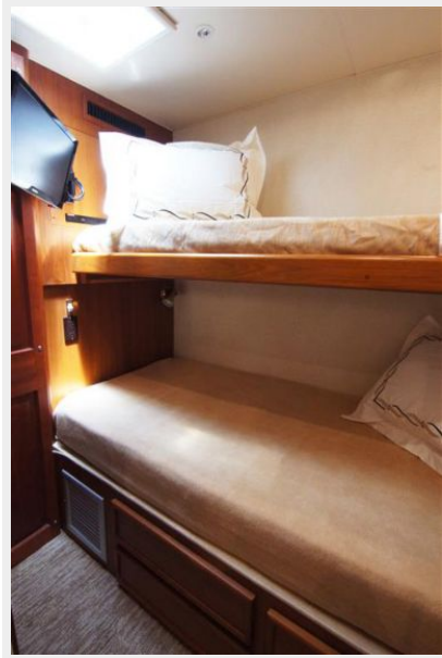
Guest Stateroom / Starboard