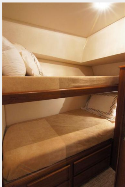
Guest Stateroom / Port