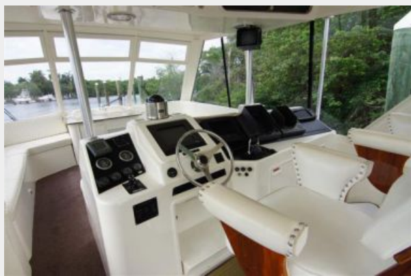
Flybridge / Helm