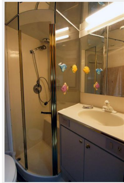
Guest Head / Starboard