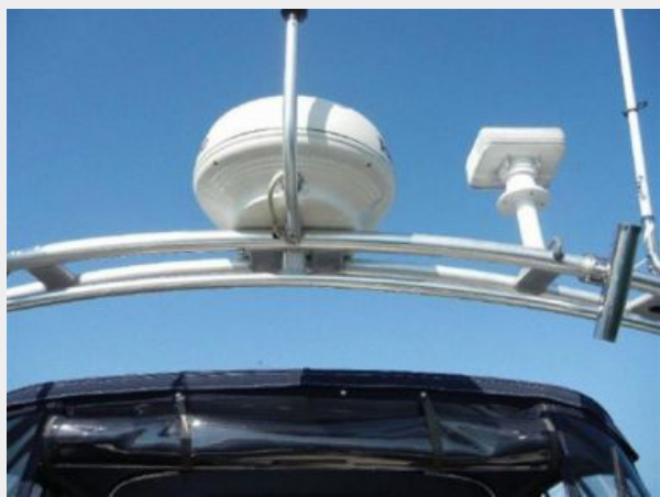
Radar & Spotlight