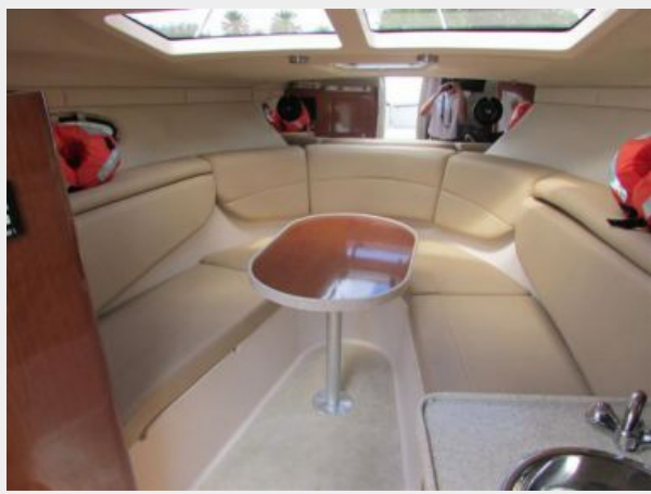
Dinette with Wraparound Seating