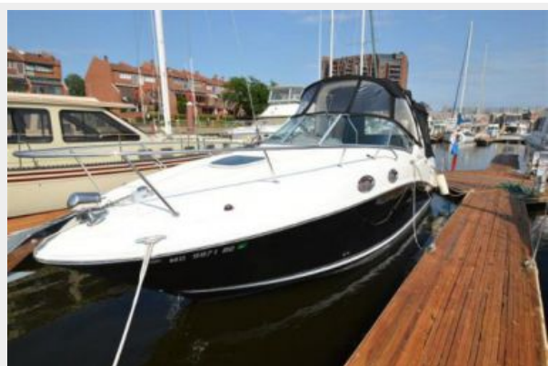
260 Sea Ray Bow