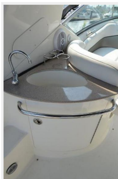
260 Sea Ray Wetbar