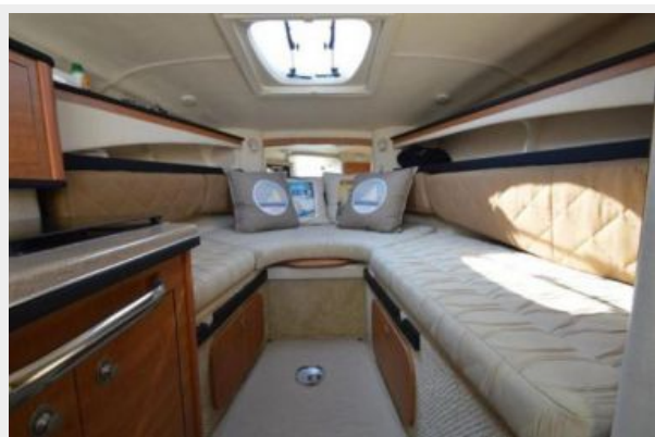
260 Sea Ray Cabin