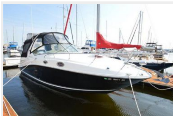
260 Sea Ray at Dock