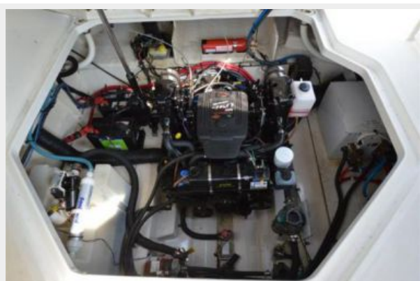
260 Sea Ray Engine Room