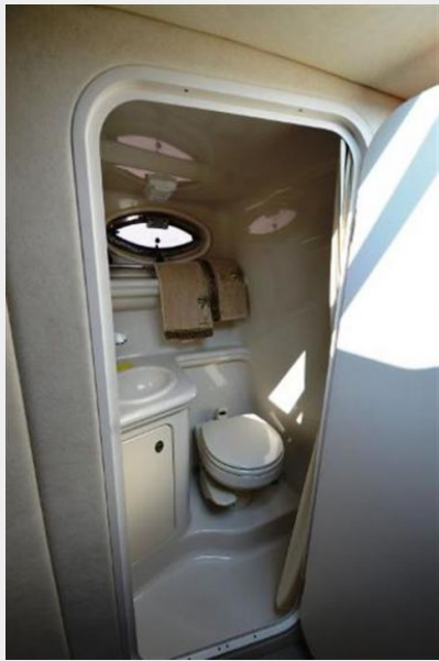
260 Sea Ray Head