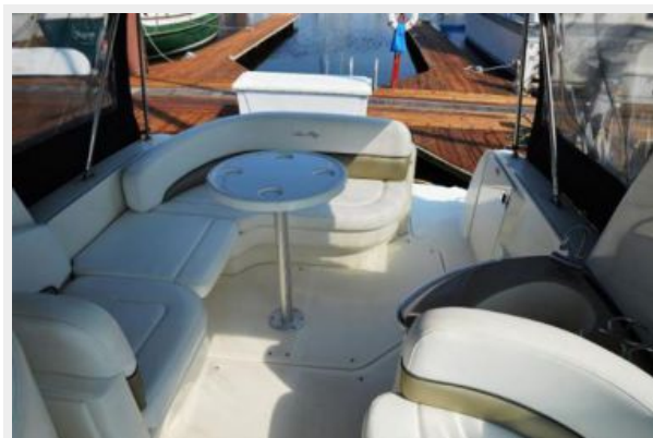
260 Sea Ray Cocpit