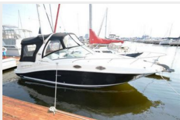
260 Sea Ray Side Profile