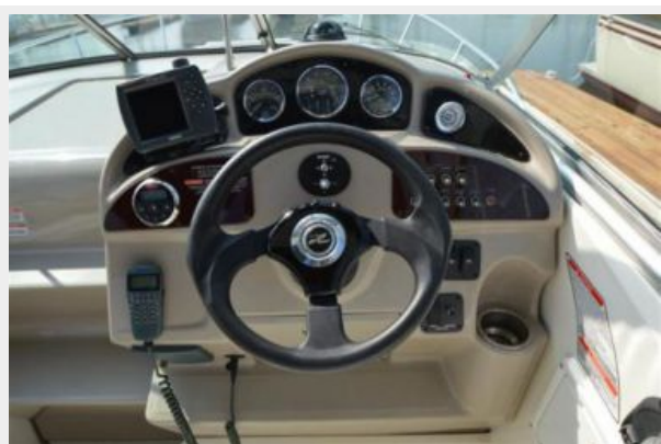
260 Sea Ray Helm