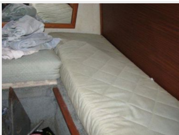
Main Cabin 3 - Aft Cabin Berth