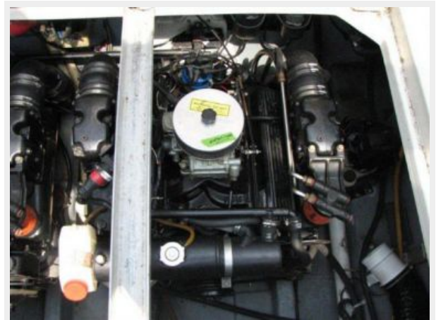
Engine & Mechanical Equipment 1 - Port Engine