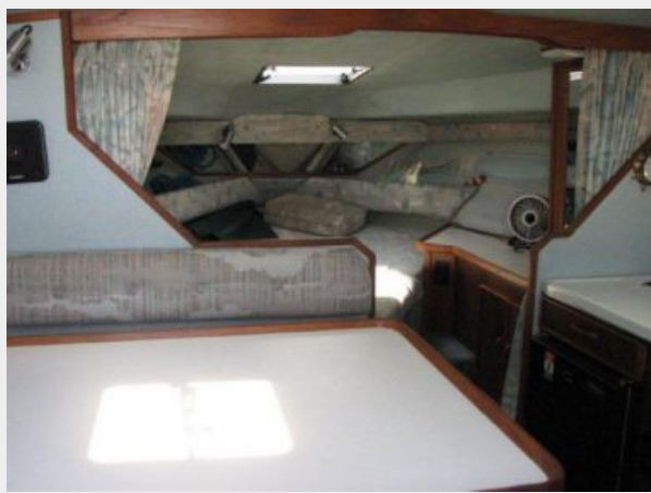
Main Cabin 1