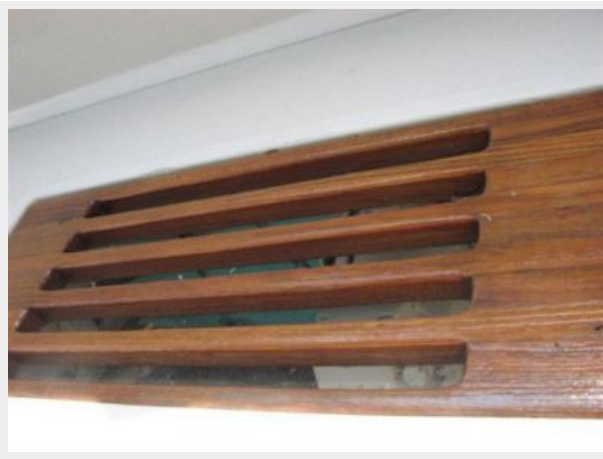
Deck 2 - Teak Swim Platform