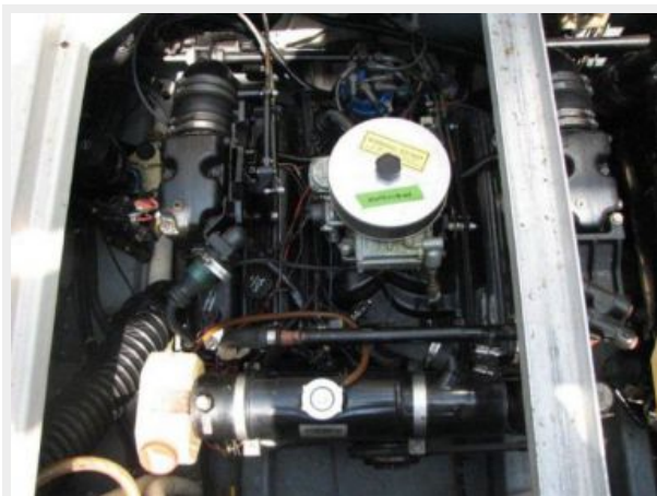
Engine & Mechanical Equipment 2 - Starboard Engine