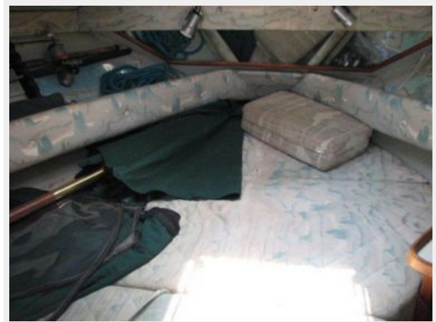
Main Cabin 2 - Forward Berth